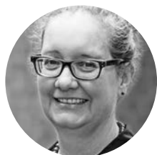
Das Interview führte: Stefanie Könecke Unternehmens- kommunikation

In Fachgeschäften sehr gut. Die Verkäufer*innen gehen toll auf die betreuten Menschen ein. Da fühlen sich meine Betreuten sehr gewertschätzt