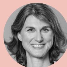
Kerrin Stumpf Elternverein

Der Bundesverband bvkm informiert über die neuen Regelungen auf seiner Website. Hier finden Sie ausführliche Erläuterungen und Beispiele. Die Beratung im Betreuungsverein erreichen Sie unter 040 270790 950. Das nächste Treffen zur besseren medizinischen Versorgung „Gute Besserung“ findet am 2. Februar 2023 um 19 Uhr im Südring statt. Kommen Sie gern dazu.