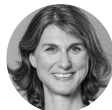
Kerrin Stumpf Elternverein

wickelten. Ein Brief bzw. eine E-Mail an die Hamburger Theater war erstaunlich erfolgreich und führte zu tollen Fundus-Spenden. Die wunderbaren Hüte und glitzernden Roben machten schon bei der Festvorbereitung Spaß. Völlig cool waren dann die Laufstegmomente und die Bilder von den Menschen, die sich an diesem Freitag im August verkleideten. Das war unsere Festivalsaison 2022 im Elternverein. Es war ein toller Nachmittag mit DJane, Waffeln und einer verzauberten Stimmung. „Das müssen wir unbedingt nochmal machen!“ hieß es zum Abschied. Vielen Dank an alle Beteiligten und Unterstützenden!